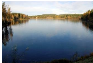
Sjöar & vattendrag Grundvatten