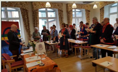
Landsmötet 2016. The national meeting 2016

Members of the RSÄ are Sami individuals and Sami organizations. The highest governing body is the national meeting, which has been held annually since 1945.