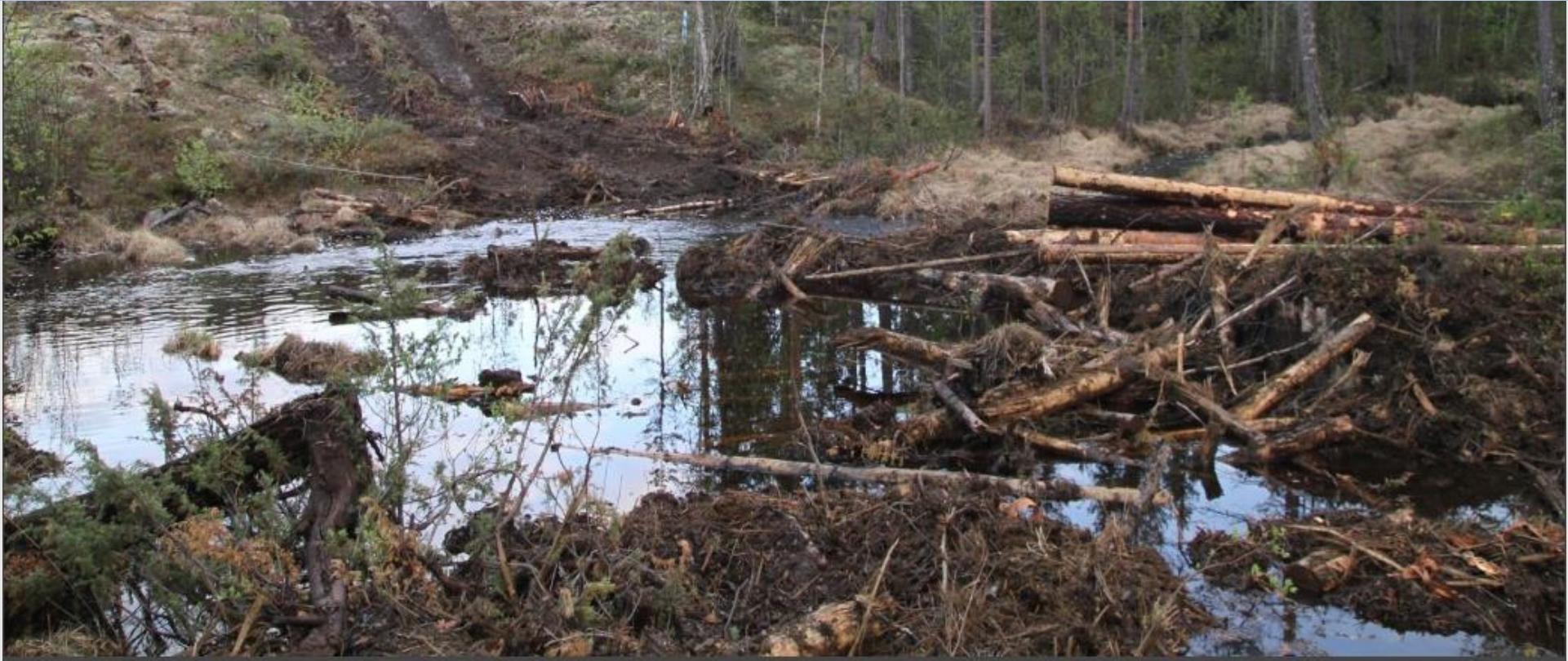
Sönderkörd bäck vid Lycksele

Stater ska genomföra åtgärder som förhindrar negativa effekter på miljön och som får konsekvenser för ekonomin och de sociala, kulturella eller andliga förhållandena hos ett urfolk