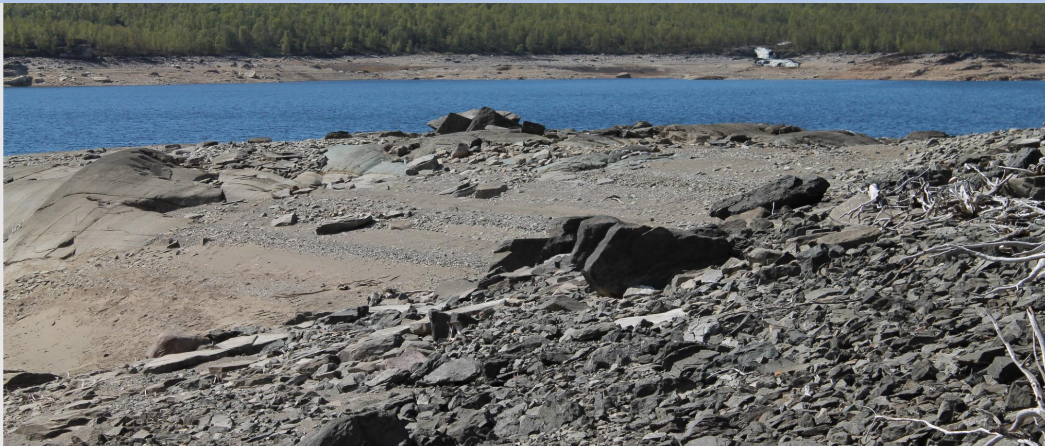
Silbojávve efter nivå- sänkning

Staterna ska möjliggöra för urfolken tillgång till, och återförande av mänskliga kvarlevor, genom en transparent process utarbetad i samråd med urfolket