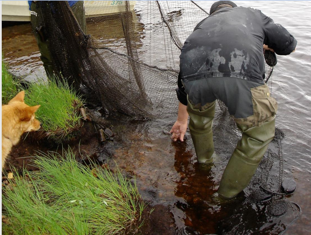
Notfiske i Luebnejávrrre

Urfolken har rätt att avgöra och utveckla prioriteringar och strategier för utvecklingen av deras land, territorier och andra resurser